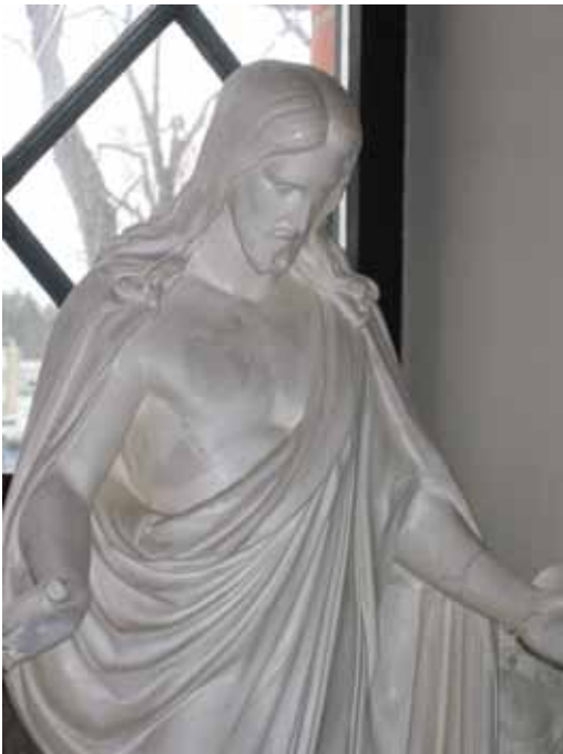
"Sillä niin on Jumala maailmaa rakastanut, että antoi ainokaisen poikansa"...