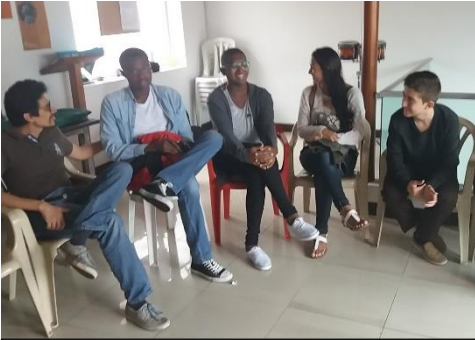
Rauhan talo –hankkeen nuoret vapaaehtoiset ja osallistujat suunnittelevat yhdessä tulevia aktiviteetteja.

Lähetykseuran tukema Rauhan talo -hanke alkoi Medellinin kaupungissa jo vuonna 2016 Emaus –seurakunnan vapaaehtoisvoimin. Vuoden 2017 alusta lähtien hankkeeseen saatiin 3-vuotinen FELMin hankesopimus. Rauhantalo-hankkeeseen kuuluu kolme osa-aluetta: Cafe Lutero, Diplomado sekä rauhankasvatus köyhän ja väkivaltaisen Comuna 13 alueella. Comuna 13 on järjestetty 4 workshopia, joiden aiheina ovat olleet: afrotanssi, elämän suunnitelmat, mitä tarkoittaa olla afrokolumbialainen Medellinissä – syrjintä, teatteriryhmä.