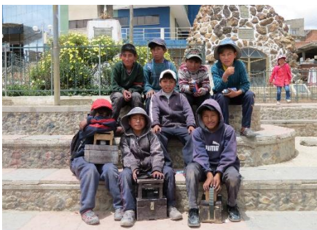
CEPROMIN-järjestö tukee mm. kengänkiillottajapoikien koulunkäyntiä Llalaguassa Lähetysseuran tuella.

Llallaguan kylä Potosin maakunnassa Boliviassa elää tinakaivoksesta. Koska tinakaivos on ehtymässä, eivät miesten ansiot riitä perheiden elättämiseen. Siksi myös isommat pojat tekevät kaivoksessa työtä, usein 12 tuntisia päiviä, syömättä. Pienemmät pojat toimivat usein kengänkiillottajina ansaitakseen perheilleen lisätuloja. Tytöt työskentelevät kauppojen apulaisina tai siivoojina. Lähetysseura tukee CEPROMIN-järjestön kautta lapsityöläisiä kouluttamalla heitä mm. kevyempiin töihin ja tukemalla heidän koulunkäyntiään.