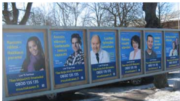
Mission organisoija, suomalainen yleiskristillinen medialähetysjärjestö IRR-TV on Euroopassa suurimpia alallaan.