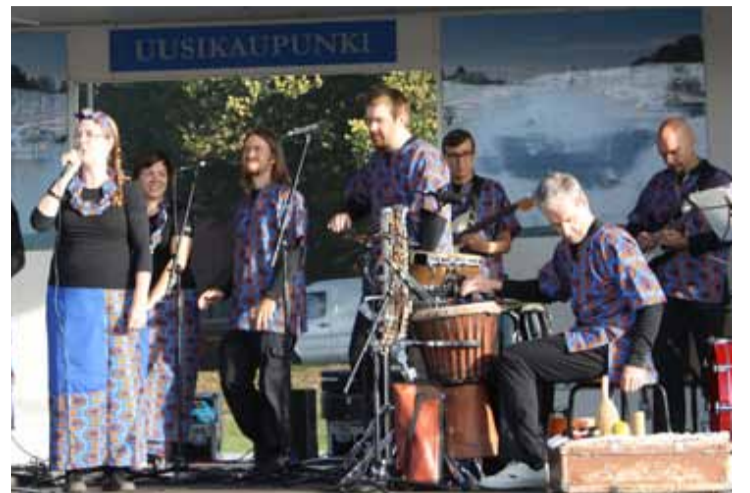
Musiikkiyhtye Jakarandan iloinen laulu ja soitto houkutteli torille tulijoita viipymään mukavassa menossa.