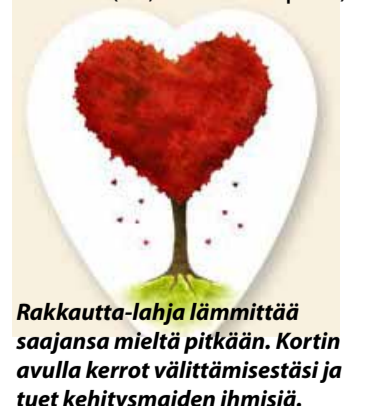
Rakkautta-lahja lämmittää saajansa mieltä pitkään. Kortin avulla kerrot välittämisestäsi ja tuet kehitysmaiden ihmisiä.

Lahjoitus: www.toisenlainenlahja.fi tai puh. 0600 9 5122 (10,02 euroa+pvm)