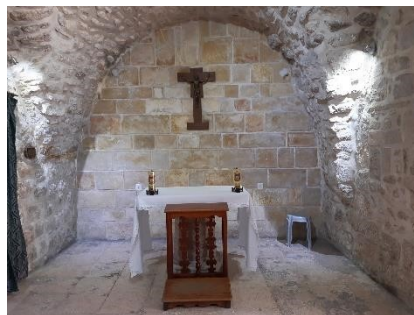
Kuva: Via Dolorosa asema 5

”...opetuslapset olivat illalla koolla lukittujen ovien takana, sillä he pelkäsivät juutalaisia... yhtäkkiä Jeesus seisoi heidän keskellään ja sanoi: ” Rauha teille! ” (Joh. 20:19,26)